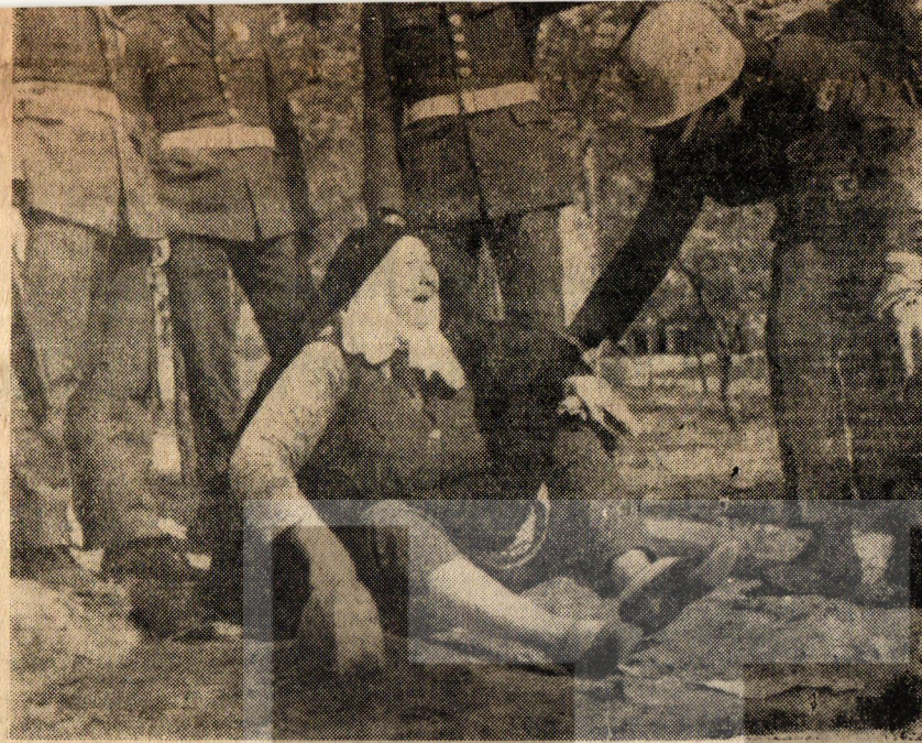
Öldürülen emekçinin karısı dövünüyor