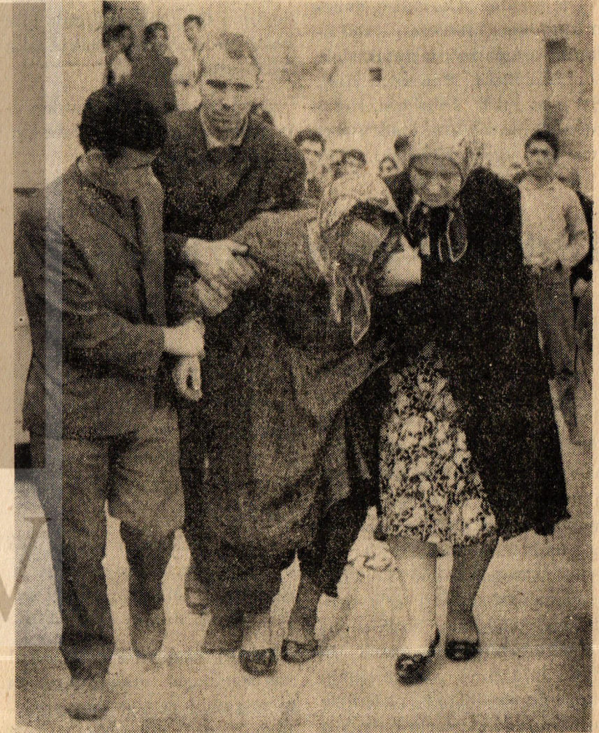
Koleralı bir hasta komşuları tarafından hastaneye götürülüyor.